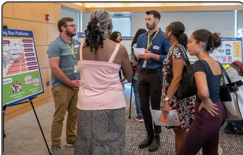
Os participantes da Reunião Aberta para a Comunidade de Mat-tapan em junho de 2024 compartilharam suas ideias e esperanças para a Blue Hill Avenue.

Este redesenho proposto visa conectar melhor os membros da comunidade com seu bairro e o resto da cidade. Um componente importante do projeto é a introdução de faixas de ônibus centrais ao longo do corredor para reduzir bastante os atrasos no trânsito, melhorar a confiabilidade do serviço e abrir caminho para mais viagens de ônibus para 40.000 passageiros de ônibus diários. Este projeto de conceito inclui entre 9 e 11 pares de plataformas de embarque de ônibus para servir como pontos de ônibus. Esses locais foram escolhidos porque fornecem aos passageiros acesso aos principais destinos da comunidade, como escolas, parques, bibliotecas, habitação, distritos comerciais e centros de saúde, ao mesmo tempo em que atendem às necessidades de serviço, como melhorar a acessibilidade e permitir o espaço certo entre as paradas. Existem algumas opções diferentes que determinarão o número final de paradas de ônibus, e a equipe do projeto deseja seus comentários/opiniões sobre o que melhor atende às suas necessidades.